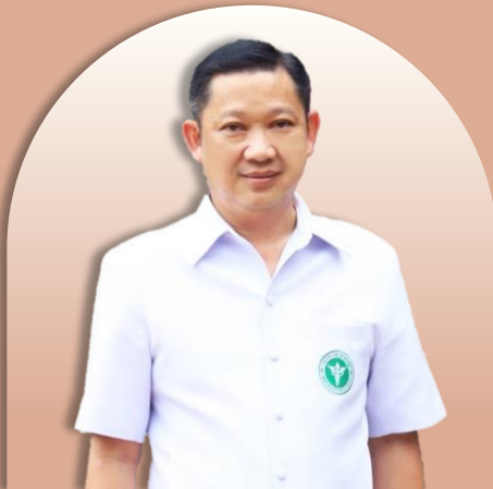
นพ.เทวัญ ธาณิรัตน์ รองอธิบดี