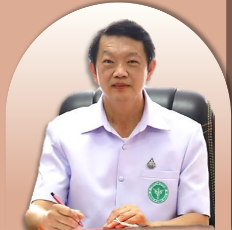
นพ.ชวัญชัย วิกิษฐานนท์ รองอธิบดี